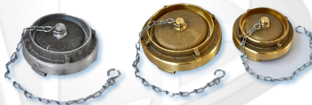
FIG.933 /FIG EQUIVALENTE MIPEL 294