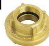
ADAPTADOR 1.1/2" ER X 1.1/2" 11BSP ROSCA INTERNA PADRÃO PETROBRAS EM LATÃO