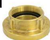
ADAPTADOR 2.1/2" ER X 2.1/2" 7.1/2NH ROSCA INTERNA PADRÃO PETROBRAS EM LATÃO