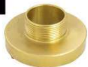
ADAPTADOR 1.1/2" ER X 1.1/2" 11BSP ROSCA EXTERNA EM LATÃO