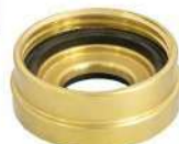
ADAPTADOR 1.1/2" ER X 2.1/2" 5FPP ROSCA INTERNA EM LATÃO