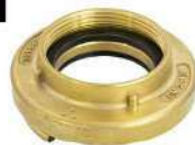
ADAPTADOR 2.1/2" ER X 2.1/2" 7.1/2NH ROSCA INTERNA EM LATÃO