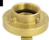
ADAPTADOR 1.1/2" ER X 1.1/2" 9NH ROSCA INTERNA EM LATÃO