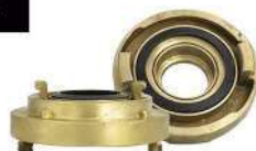
REDUÇÃO GIRATÓRIA 2.1/2" ER X 1.1/2" STORZ EM LATÃO