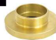
ADAPTADOR 2.1/2" ER X 2.1/2" 11BSP ROSCA EXTERNA EM LATÃO