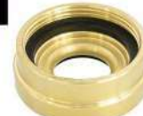
ADAPTADOR 1.1/2" ER X 2.1/2" 7.1/2NH ROSCA INTERNA EM LATÃO