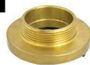
ADAPTADOR 2.1/2" ER X 2.1/2" 7.1/2NH ROSCA EXTERNA EM LATÃO