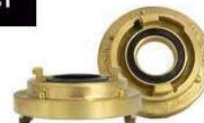
REDUÇÃO FIXA 2.1/2" X ER 1.1/2" STORZ EM LATÃO