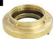
ADAPTADOR 2.1/2" ER X 2.1/2" 5FPP ROSCA INTERNA EM LATÃO