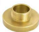
ADAPTADOR 1.1/2" ER X 1.1/2" 9NH ROSCA EXTERNA EM LATÃO